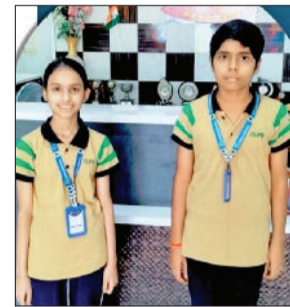
नारनौल। विजेता छात्राएं।