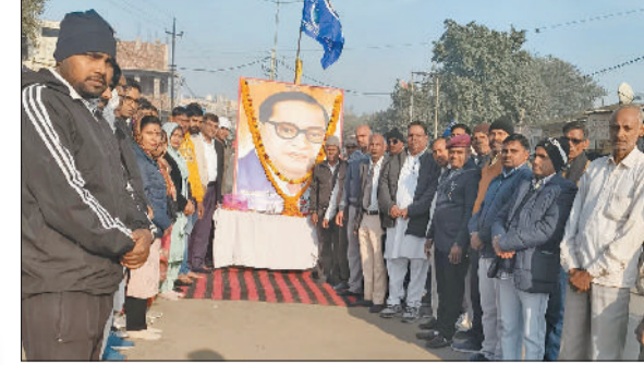
मिवानी। बवानीखेड़ा में अंबेडकर के चित्र पर पुष्प अर्पित करते हुए।

में हिस्सा लेते हैं, ऐसे में खिलाड़ियों को अधिक से अधिक खेलने के अवसर प्रदान करने जरूरी है। प्रधानमंत्री श्री मोदी ने इसी के चलते ही फिट इंडिया के नाम पर युवाओं को प्रोत्साहित किया, जिसके बड़े सकारात्मक परिणाम सामने आ रहे हैं।