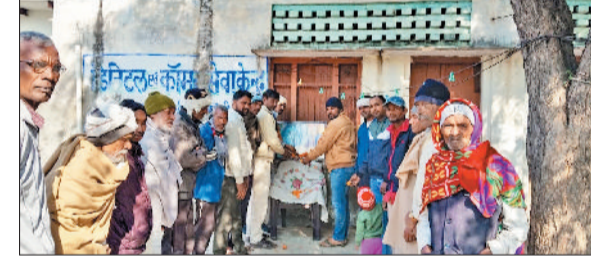
मिवानी। अंबेडकर के चित्र पर पुष्प अर्पित करते हुए।