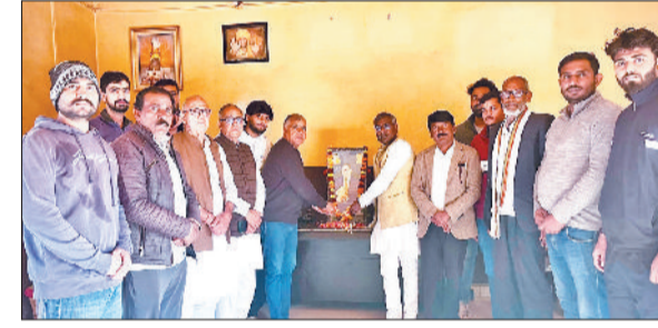
चरखी दादरी। डॉ. भीमराव अंबेडकर के चित्र पर पुष्प अर्पित करते कांग्रेसी।