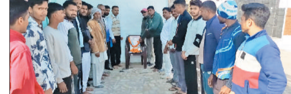
बवानीखेड़ा। बवानी खेड़ा क्षेत्र के अंतर्गत आने वाले गांव बलियाली में डॉ. भीम राव अंबेडकर का महापरिनिर्वाण दिवस मनाते हुए।