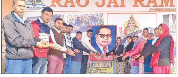
महेंद्रगढ़। बाबा साहेब के चित्र पर पुष्पापित करते हुए।