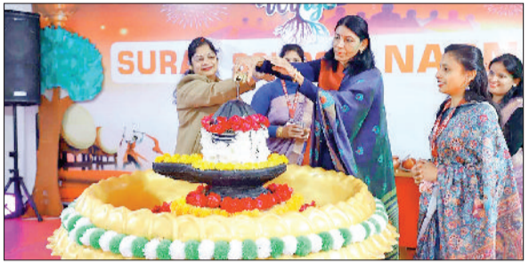
महेंद्रगढ़। रुद्राभिषेक करते हुए।