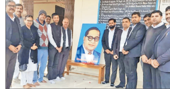
लोहारू। कोर्ट परिसर में बाबा साहेब को श्रद्धांजलि देते हुए लोहारू बार एसोसिएशन के अध्यक्षतागण।