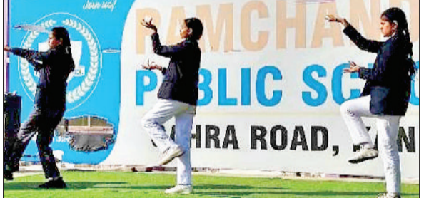
महेंद्रगढ़। कार्यक्रम में अपनी प्रस्तुति देती छात्राएं।