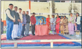
मिवानी। डॉ. अंबेडकर के चित्र पर पुष्प अर्पित करते हुए।