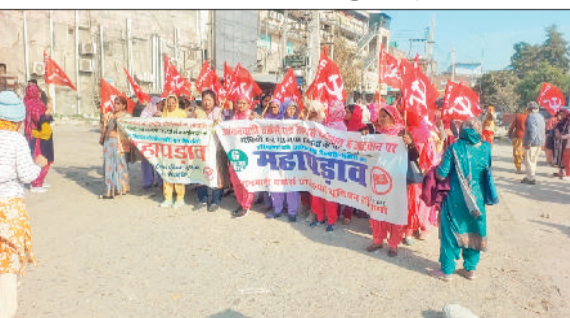
मिवानी। मांगों को लेकर शहर में जुलूस निकालती हुई।